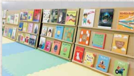
20冊、30冊、50冊のセットがあり、すぐに絵本展を開くことができます。