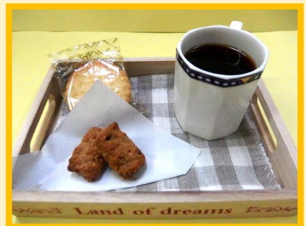
飲み物はお代わり自由です♪